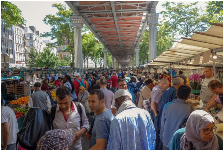
Markttag in Barbès