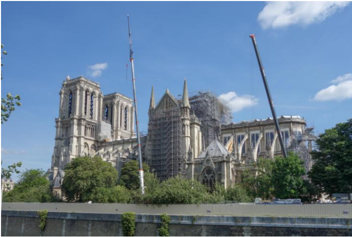
Kathedrale Notre-Dame mit Baugerüst nach dem Brand

Das Turnier war gut organisiert, die Turnierleitung immer ansprechbar! Ein Rundenbeginn um 19:00 erscheint etwas spät, für mich jedoch ideal um Paris zu erkunden. Eine Stadt bei der man hinterher feststellt, was man alles nicht gesehen hat und sich sagt „da sollte ich nochmals hin“