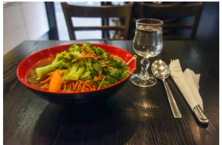
Die Mega-Suppenschüssel beim Chinesen