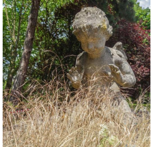
sehenswerte Friedhöfe mit bekannten Verstorbenen