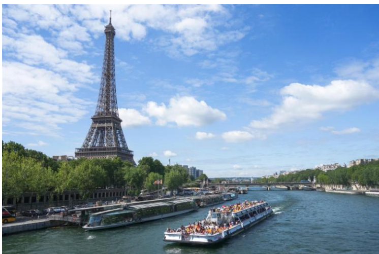
Bootsfahrt auf der Seine