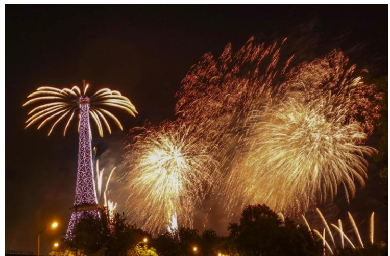
letzte Runde am 14.Juli - französischer Nationalfeiertag